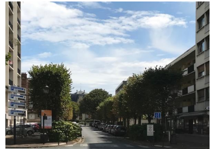
Avenue Georges Clémenceau -Août 2020