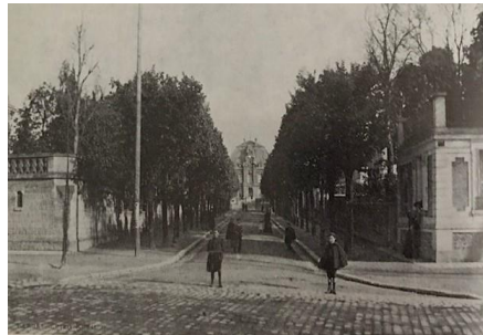
Avenue Georges-Clémenceau en 1925-(Ancien passage Martignon puis Avenue de la Mairie)

Avenue Georges Clémenceau en centre ville