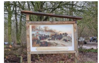
Cette porte était située à l'entrée du Bois de St-Cucufa. Les combats qui s'y déroulèrent le 21 octobre 1870 ont été illustrés par le peintre Alphonse de Neuville.